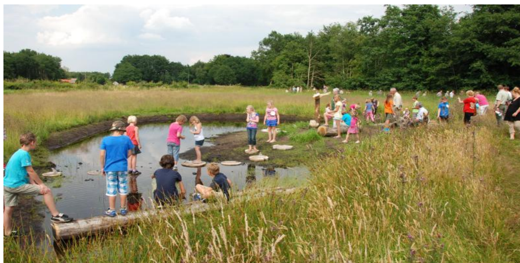
Speelnatuur De Wheem

http://www.landschapoverijssel.nl/eropuit/routes (routes Landschap Overijssel)